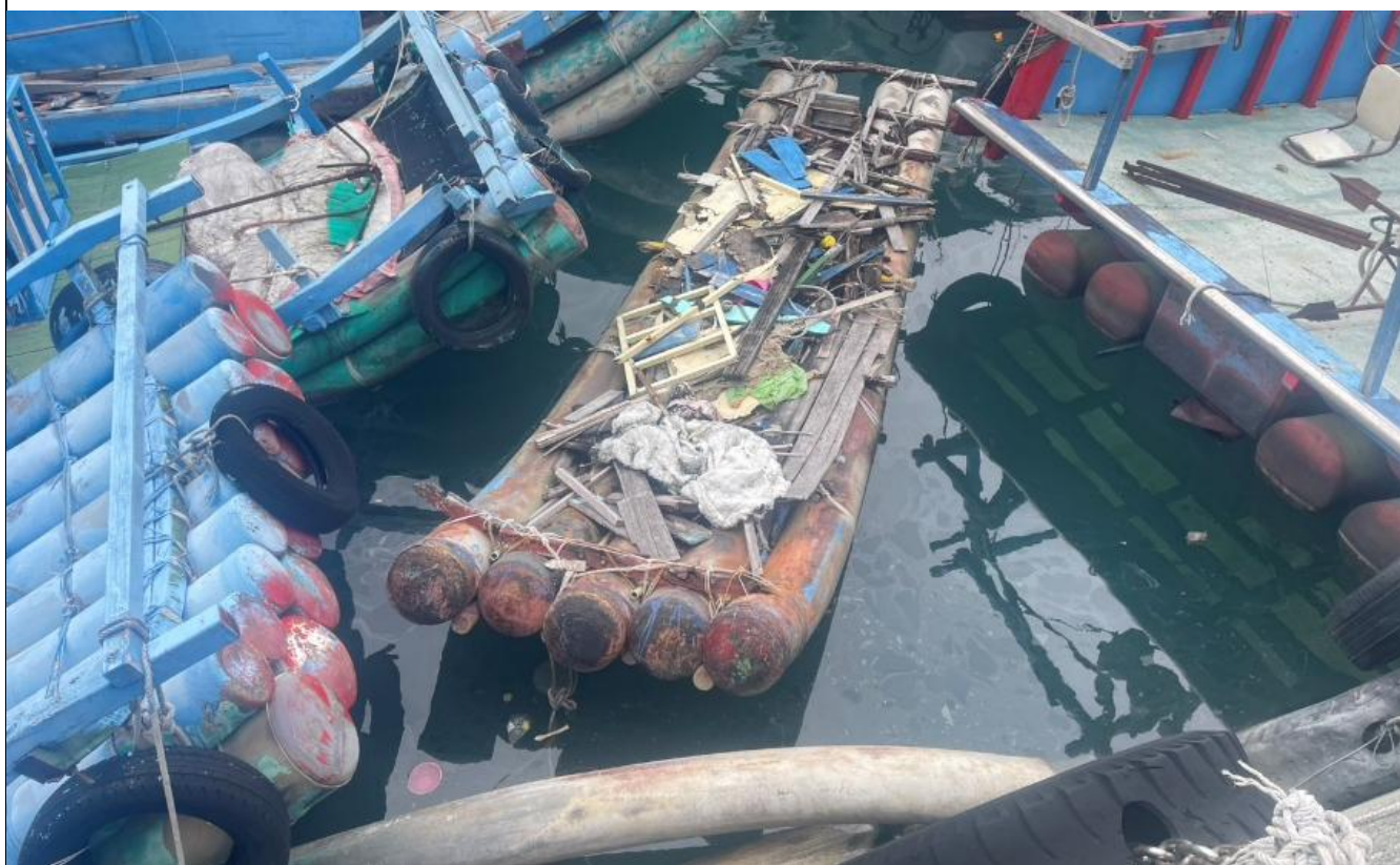
新港漁港無籍船筏照片