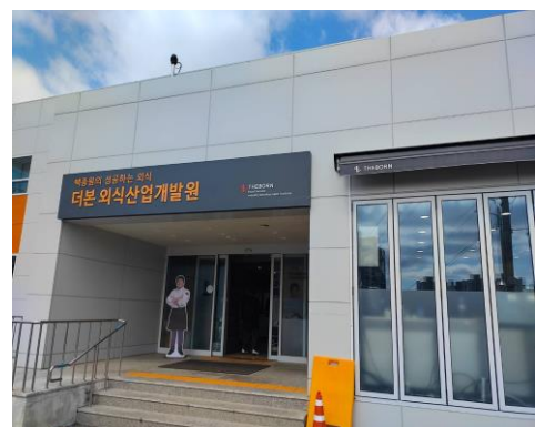
禮山市白種原青創基地