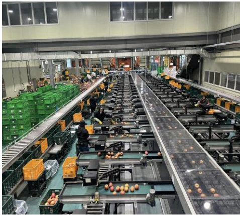
禮山市蘋果集散中心