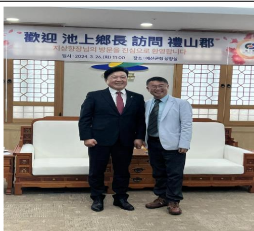
池上鄉長林建宏拜會禮山郡郡守-崔載久