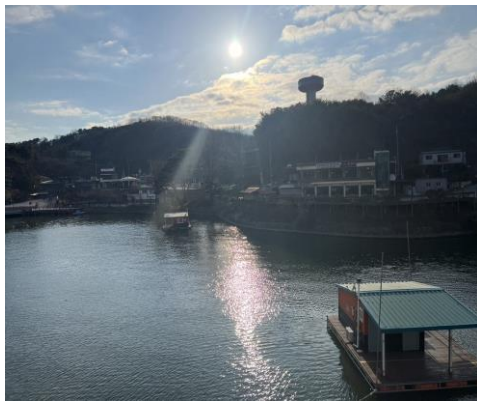
禮山市禮唐湖-景觀台餐廳