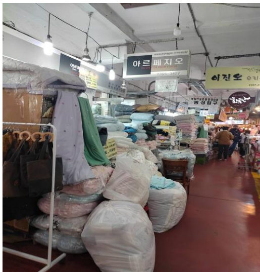
廣藏市場販賣棉被店鋪