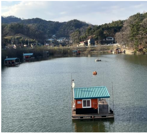
禮山市禮唐湖-出租釣魚船屋