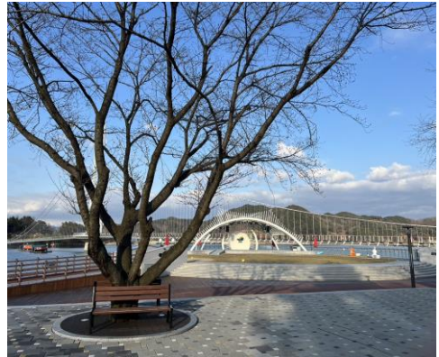
禮山市禮唐湖-吊橋