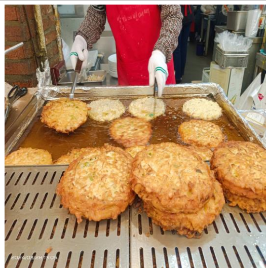
廣藏市場販售綠豆餅店鋪