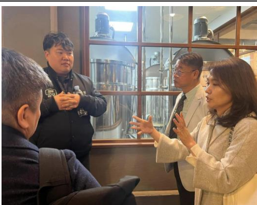
參訪禮山市場-釀酒基地(一)