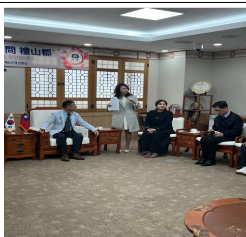
本鄉參訪人員與禮山郡進行交流會議