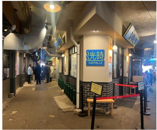
禮山市場市場內打卡景點之一