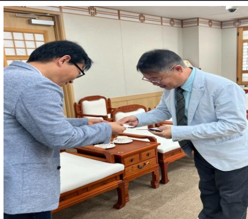
本鄉鄉長與禮山郡公部門人員交換名片