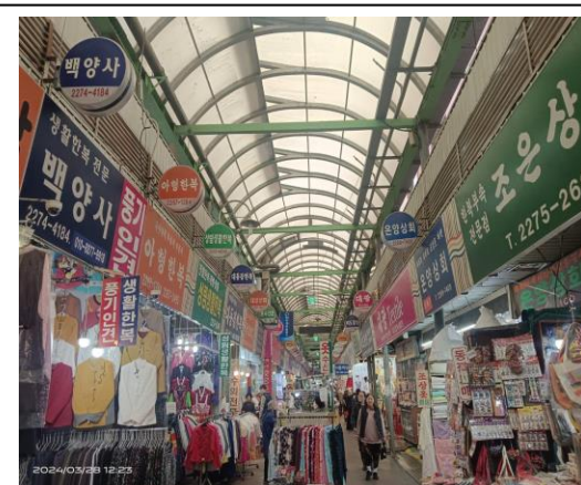
廣藏市場販賣衣服、雜物被等店鋪