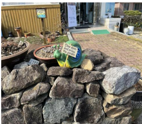
大興面-友好家庭庭院