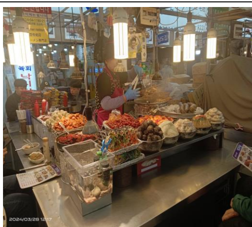
廣藏市場販售韓國特有血腸等小吃