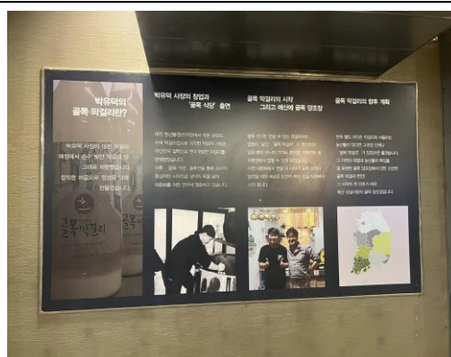
參訪禮山市場-釀酒基地(二)