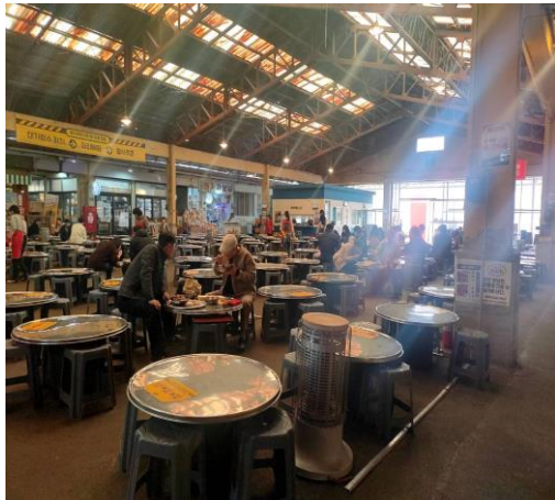
禮山市場公共餐廳