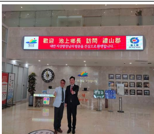
禮山郡特別於大廳顯示歡迎本鄉參訪