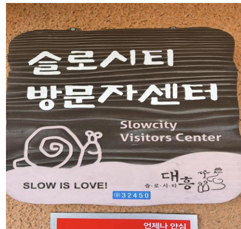
大興面-慢城遊客中心標緻